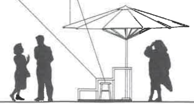
LAUKO PREKYBOS VIETA 1.5x2.0m, 3m 2